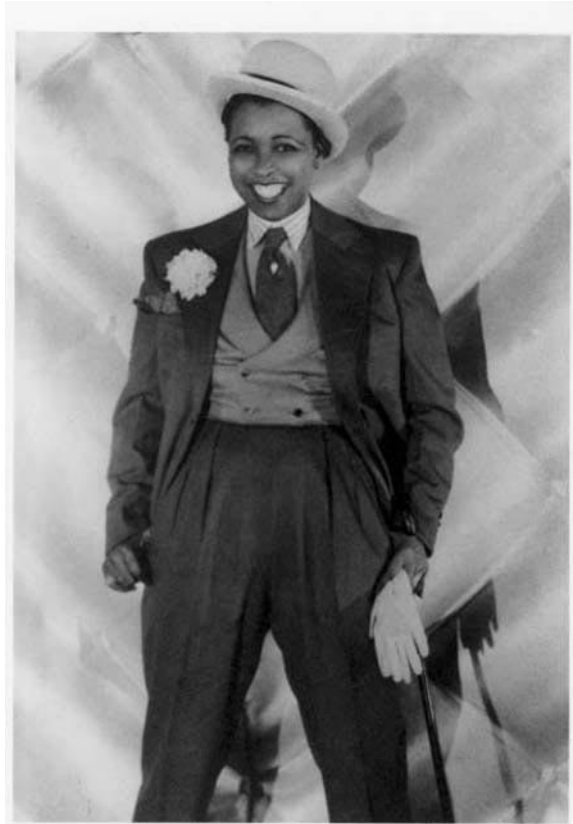
Figure 5: Ethyl Waters as a bulldagger icon.